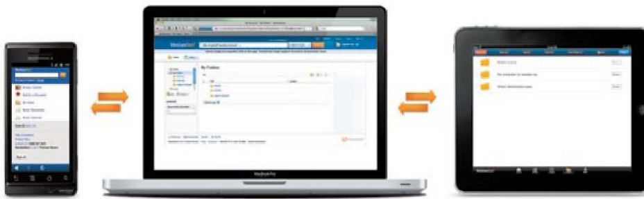
WestlawNext는 PC와 스마트 기기를 자동 동기화하므로, 모든 검색이력은 언제나 최신성을 유지합니다.